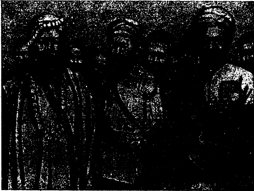
פויערים—אויסשטענלעך אין אינדיע

לאגע אין כינע. די אפריקאנישע נענערס האבן אפילע ניט קיין אלעפבייוו. אסאך קאלאניאלע פעלקער פון העם פריערדיקן צארישן דומלאנד האבן אויך ניט געהאט קיין אייגענעם אלעפבייוו. אזוי, אז אפילע לערנען זיך שרייבן קאנען אויך ניט דיאזויקע פעלקער. אין דערזעלבער צייט קאנען די אונטערדיקער זיך באנוצן ניט נאר